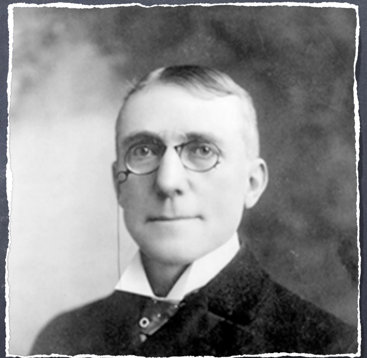
James Whitcomb Riley "If it looks like a duck and quacks like a duck, it must be a duck."